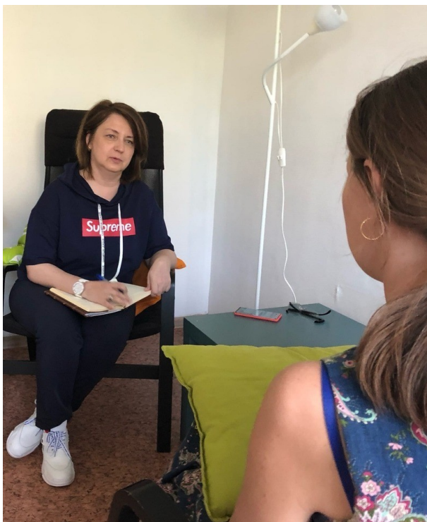
Консультация с подопечной фонда

Когда человеку ставят онкологический диагноз, это меняет его жизнь. И речь не только о том, что теперь ему предстоит частое посещение врача, операция или сложное лечение, реабилитация, отказ от привычного распорядка и образа жизни. Меняются и отношения с близкими — родителями, детьми, супругами. А если вокруг бушует опасный вирус, все усложняется еще больше.